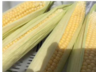
作品（トウモロコシ ホウレンソウ）