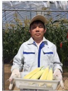
作業風景(収穫手伝い)