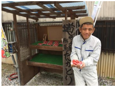
作業風景(出荷準備 陳列)