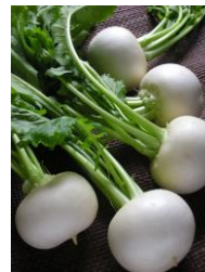
作品（カブ インゲン豆）