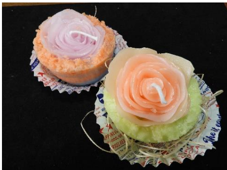
※一例 … ローズ