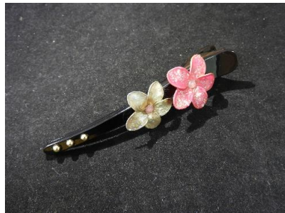
ワイヤー作品(バレッタ)

今年度は新たに、小物作品づくりにも挑戦し 針金を使ったワイヤー作品もつくっております。