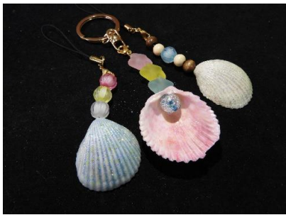
貝殻ストラップ ・ キーホルダー